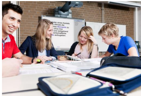
Lernbüro an der Handelslehranstalt