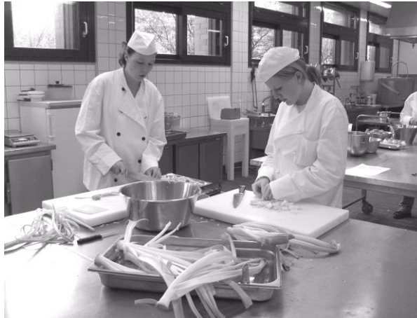
Ausbildung in der Großküche

Sie haben bis zu 36 Stunden Unterricht pro Woche. Er wird montags bis freitags vorwiegend in der Zeit von 8:00 - 14:45 Uhr in unserer Schule erteilt. Für Ihre praktische Ausbildung im Betrieb gelten die dort festgelegten Arbeitszeiten.