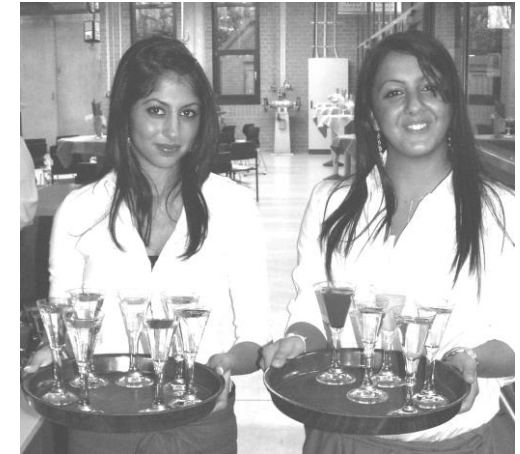
Ausbildung im Service

Nach dem Besuch der Berufsfachschule haben Sie die Schulpflicht erfüllt, wenn Sie anschließend kein Ausbildungsverhältnis eingehen.