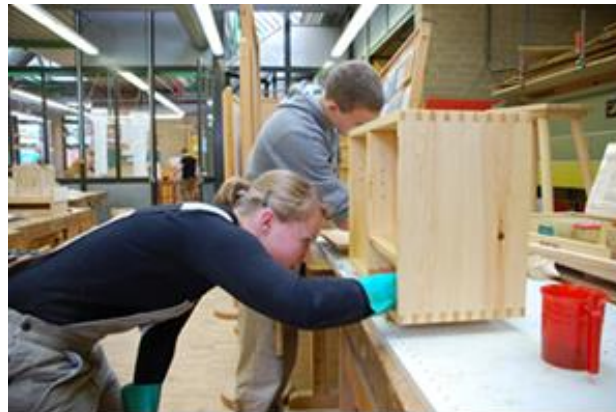
Unterricht in der Fachrichtung Holztechnik