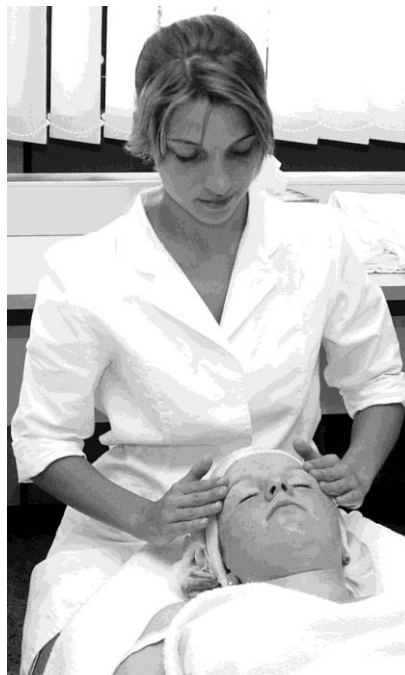
Kosmetikbehandlung im Fachpraxisunterricht

Sie haben 36 Stunden Unterricht pro Woche. Er findet von Montag bis Freitag zwischen 8:00 und 14:45 Uhr statt. In der Klasse II findet die Ausbildung an 2 Tagen in einem Kosmetikinstitut und an 3 Tagen in der Berufsschule statt.