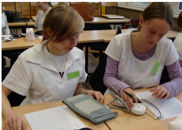
Grundkompetenzen pflegerischen Handelns

Mindestens 160 Stunden des berufsbezogenen Lernbereichs – Praxis – werden Sie als praktische Ausbildung in geeigneten Betrieben durchführen.