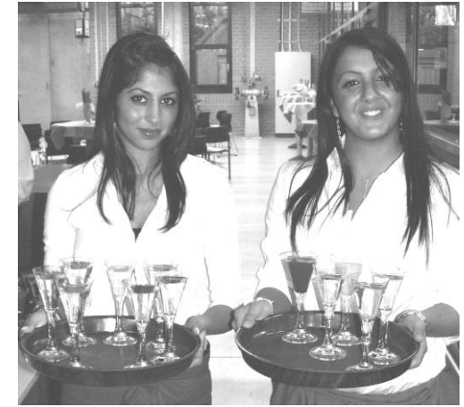
Ausbildung im Service

Nach dem Besuch der Berufsfachschule haben Sie die Schulpflicht erfüllt, wenn Sie anschließend kein Ausbildungsverhältnis eingehen.