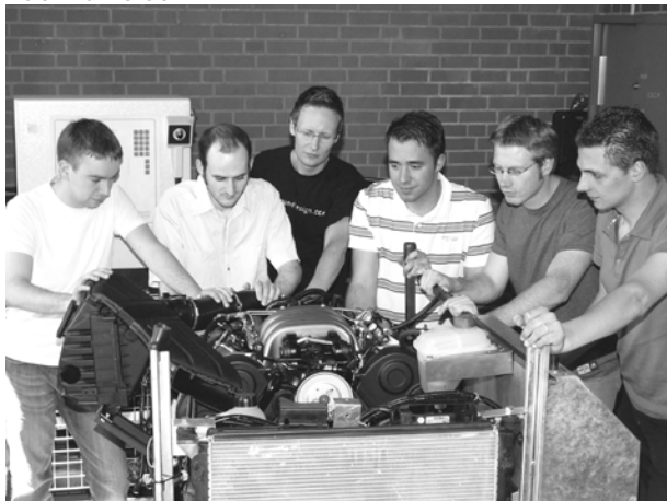
Teamarbeit am V6-Standmotor

Voraussetzung für die Aufnahme sind der Haupt- und Berufsschulabschluss/Berufsabschluss als KFZ-Mechatroniker/-in, KFZ-Mechaniker/-in, Automobilmechaniker/-in oder als KFZ-Elektriker/-in. Darüber hinaus ist eine mindestens einjährige Berufstätigkeit in einem der genannten Berufe nachzuweisen.