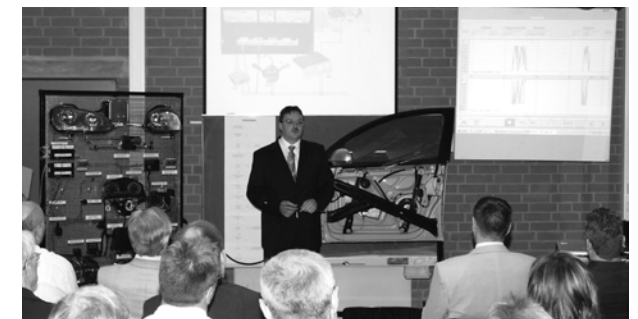
Präsentation von Arbeitsergebnissen

Alternativ besteht die Möglichkeit nach dem Aufstiegsfortbildungsförderungsgesetz Meister-BAföG zu beantragen beim Niedersächsisches Landesverwaltungsamt, Auestr. 14, 30169 Hannover