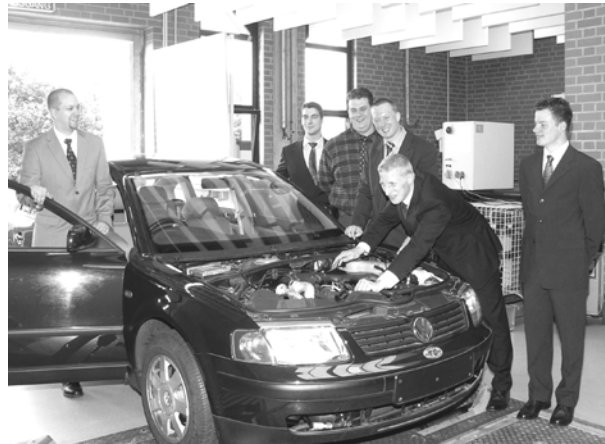
Demonstration eines Versuchsablaufs