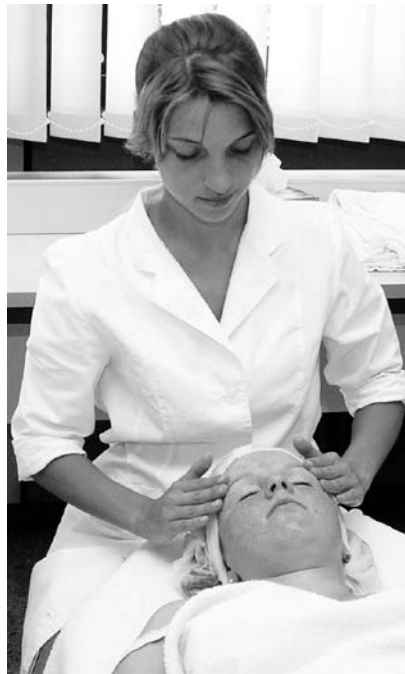
Kosmetikbehandlung im Fachpraxisunterricht

Sie haben 36 Stunden Unterricht pro Woche. Er findet von Montag bis Freitag zwischen 8:00 und 14:45 Uhr statt. In der Klasse II findet die Ausbildung an 2 Tagen in einem Kosmetikinstitut und an 3 Tagen in der Berufsschule statt.